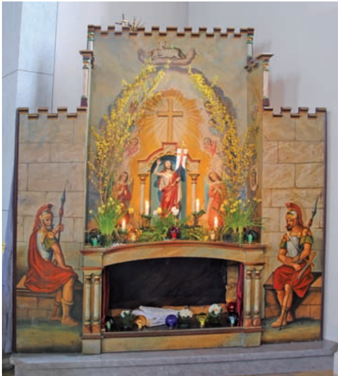
Rettung und Renovierung für ein Hl. Grab im Bayerischen Wald