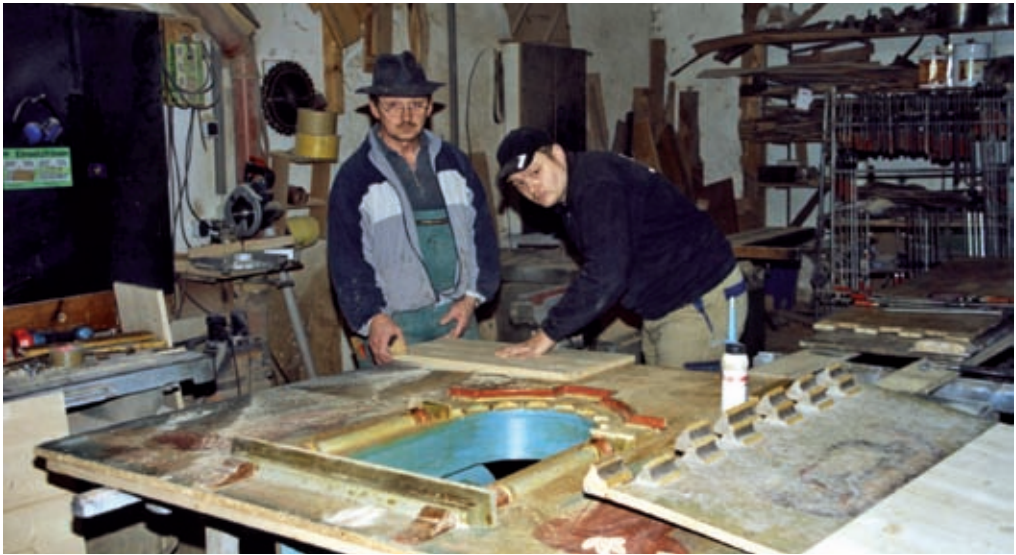
Umsichtige und überlegte Restaurierung nach Beratung mit Fachleuten

ten, vom Altartisch war nur noch das geschwungene Vorderteil vorhanden. Nach Beratungen mit Fachleuten entschied man sich für das „Modell Nr. 4“. Es nimmt weniger Platz ein, zeigt die Malereien am besten, verursacht den geringsten Aufwand beim Restaurieren und hat das Konzept eines Flügelaltars. Damit harmoniert das Hl. Grab hervorragend mit dem Flügelaltar des Gotteshauses, geschaffen von Wolf Hirtreither aus Gröbenzell.